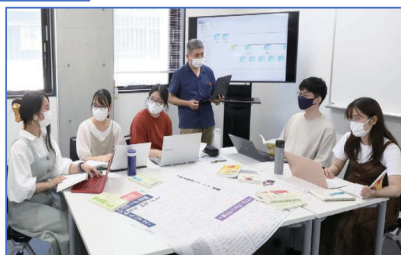
教養教育改編委員会 情報部会が中心となり講義内容を検討